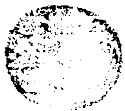
صورة الصفحة الأخيرة من الجزء الثاني من مخطوطة دار الكتب المصرية